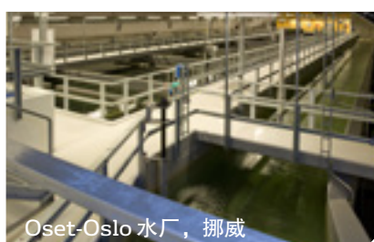
Oset-Oslo 水厂, 挪威