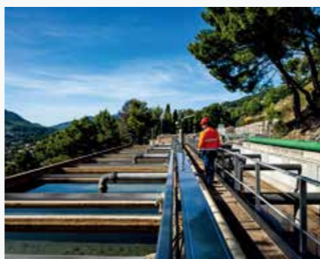
饮用水处理厂和污水处理厂